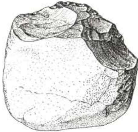
Рис. 1. Чопер з Рокосового (ашель).