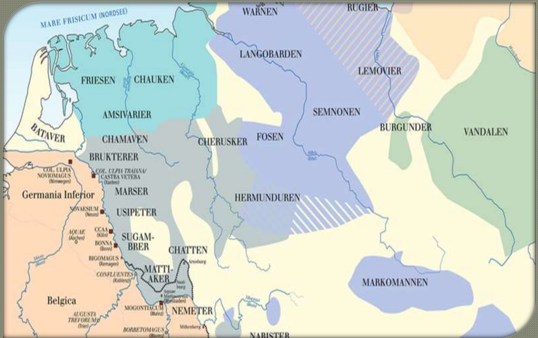
Karte der Germanischen Stämme um 100 n. Chr