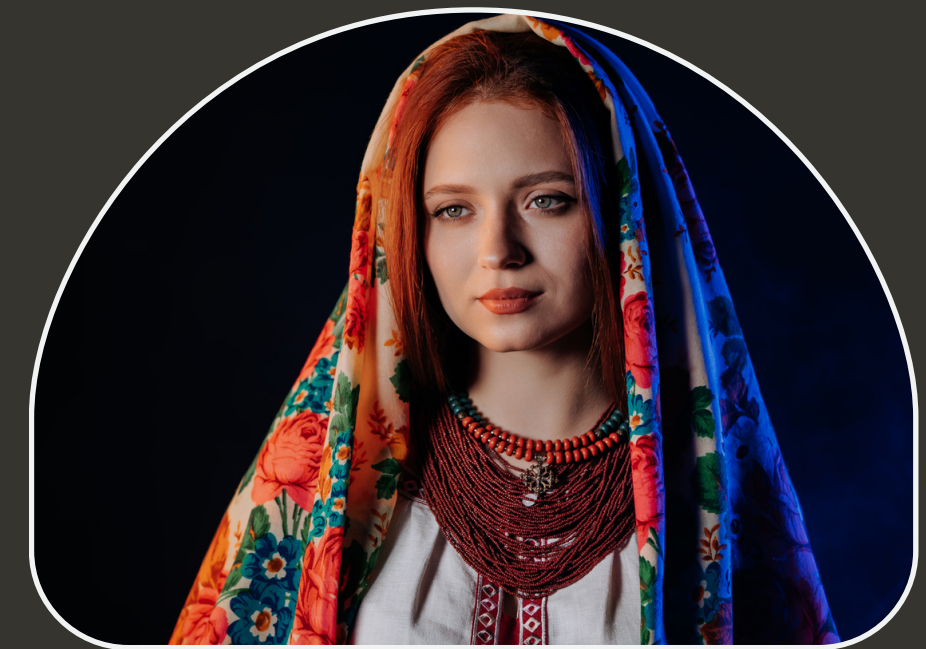
III. Духовна культура українського етносу