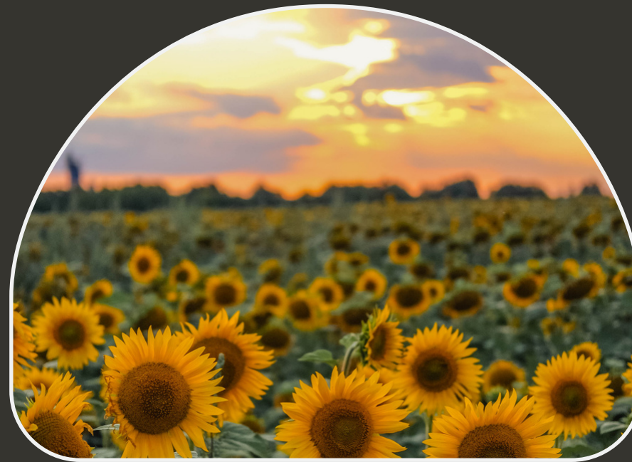
II. Господарство і матеріальна культура українців