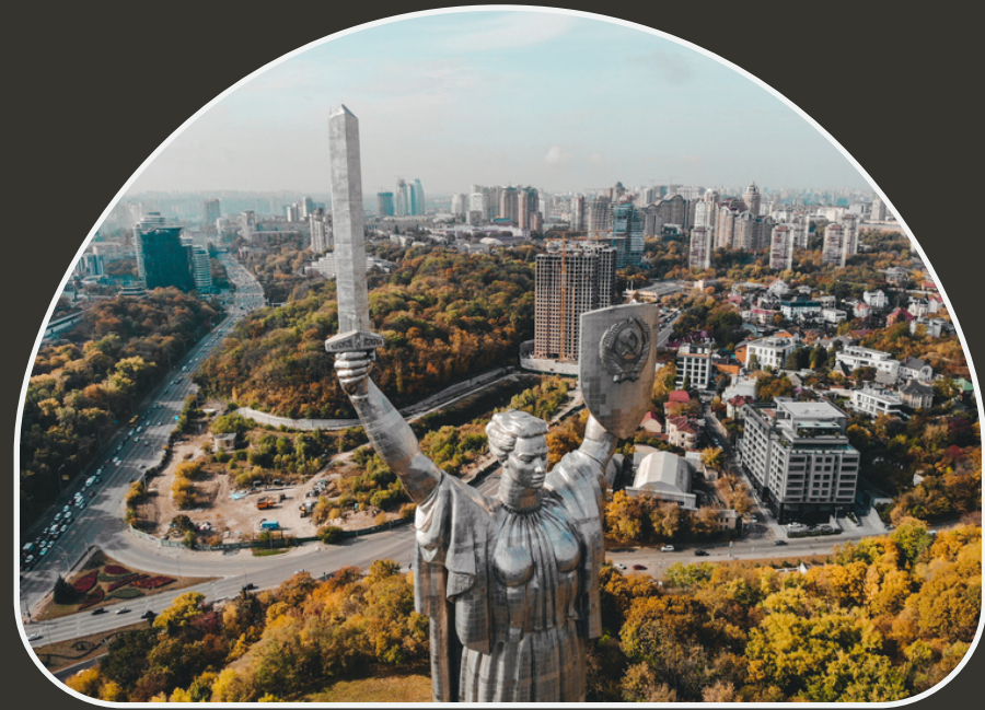
I. Етнічна історія українців