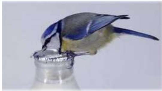
Синиці навчилися ласувати вершками