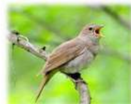
Пташенята наслідують спів молодих особин