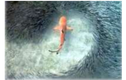
Риби виробляють реакцію на появу хижака