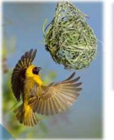
Птахи стають досвідченими у гніздобудуванні