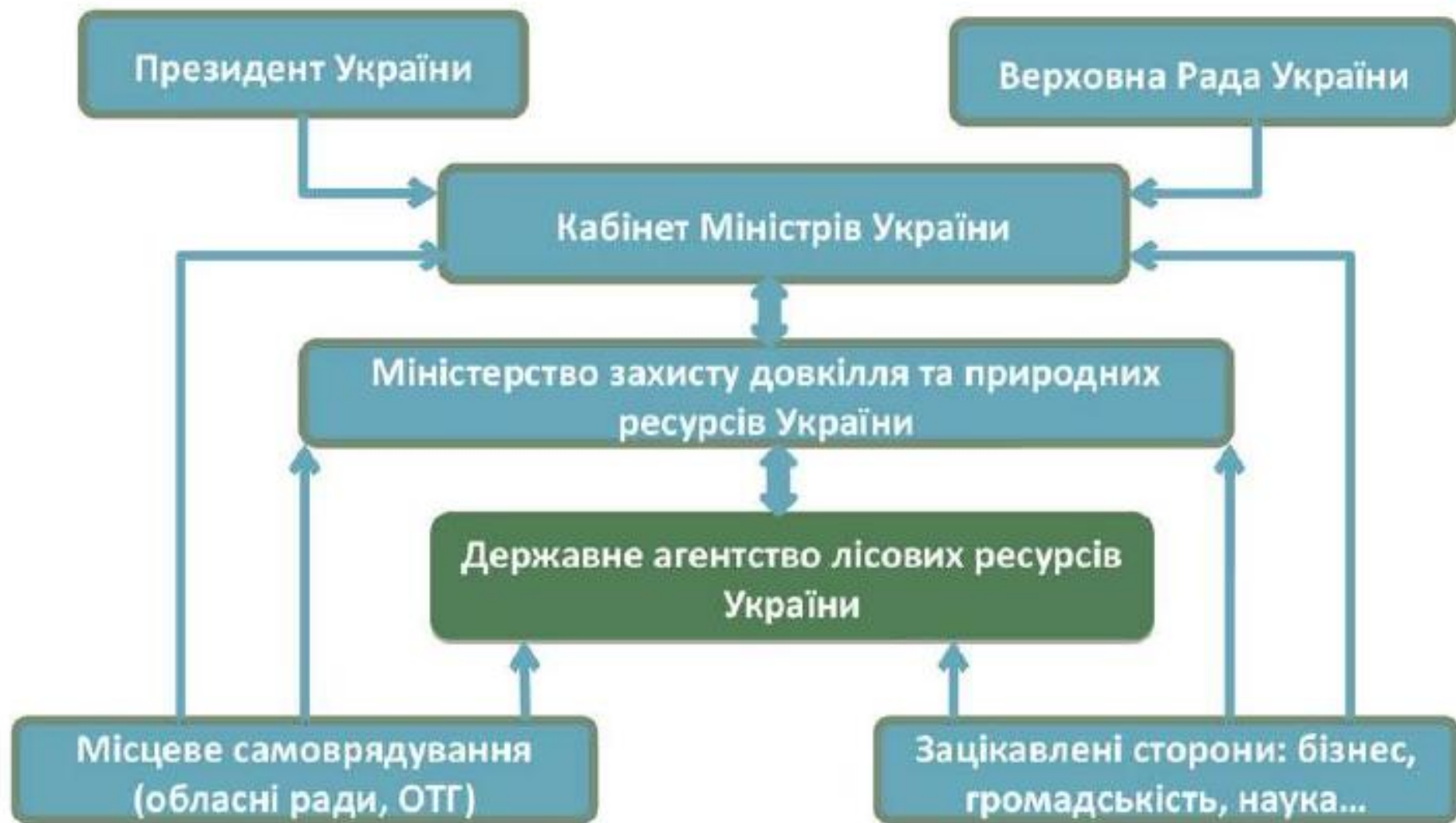
Структура менеджменту Державного агентства лісових ресурсів