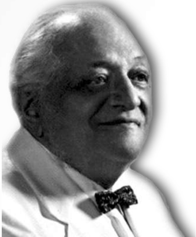
Якоб Леві Морено

«Психодрама – метод, що розкриває істину душі в дії...»