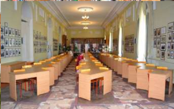
Читальний зал. Електронна бібліотека