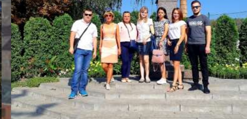
Копныс № 1