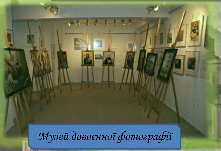
Музей довоєнної фотографії

У музеях відбуваються навчальні заняття, засідання гуртків