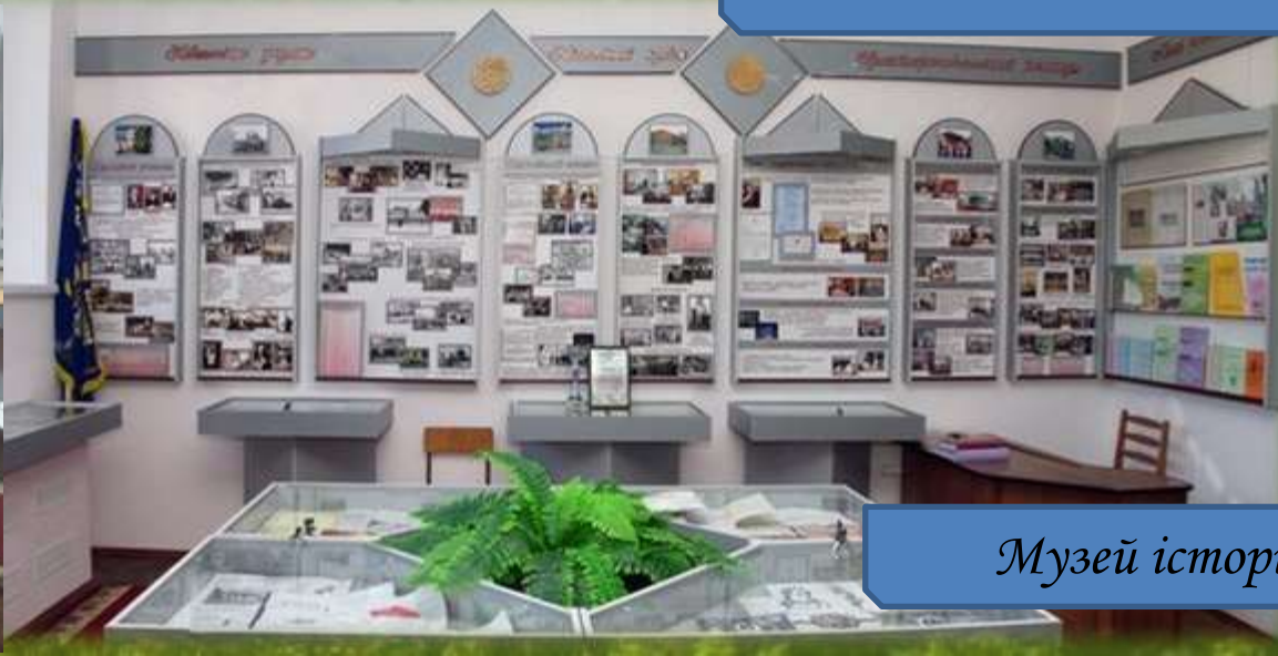
Музей історії освіти