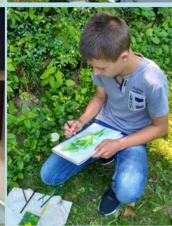
Художня еко-арт майстерня, 14-18 серпня 2017 р.