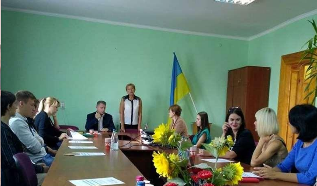
Тренінг «Екологічна освіта громадськості», 22.08.2017 р.