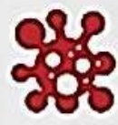
СПИСУВАННЯ ПИСЬМОВИХ РОБІТ ІНШИХ СТУДЕНТІВ