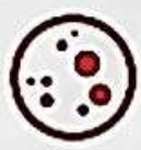
КОПІЮВАННЯ ЧУЖОЇ НАУКОВОЇ РОБОТИ ТА ПРИВЛАСНЕННЯ РЕЗУЛЬТАТІВ ПРАЦІ