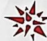
ЗГАДУВАННЯ ДЖЕРЕЛА БЕЗ ПОСИЛАННЯ