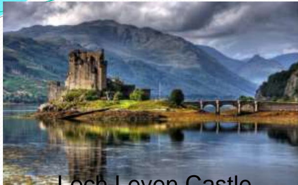
Loch Leven Castle