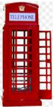
Red telephone booth