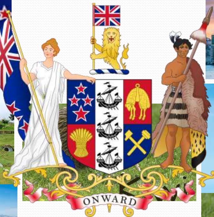
National Emblem of New Zealand