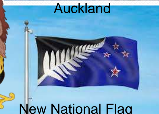
New National Flag