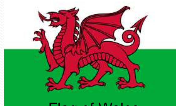
Flag of Wales