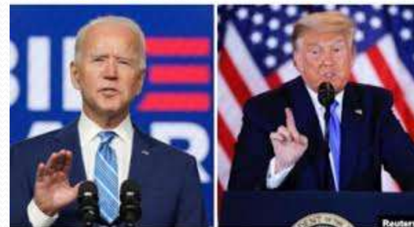
J. Biden / D. Trump