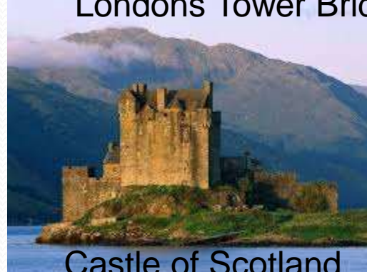
Castle of Scotland