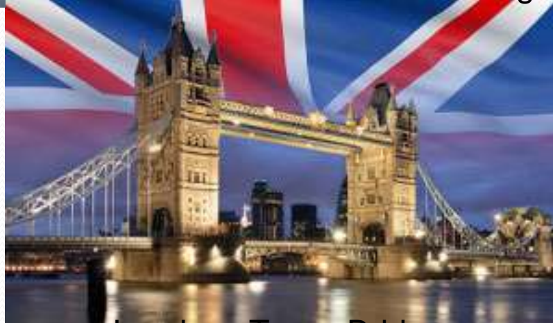
London's Tower Bridge