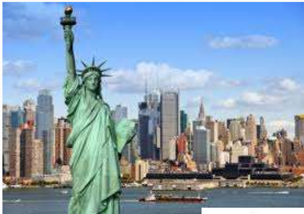
Statue of Liberty