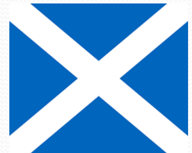
Flag of Scotland