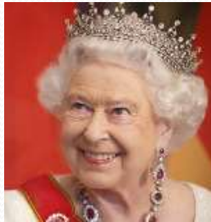
Queen Elizabeth II