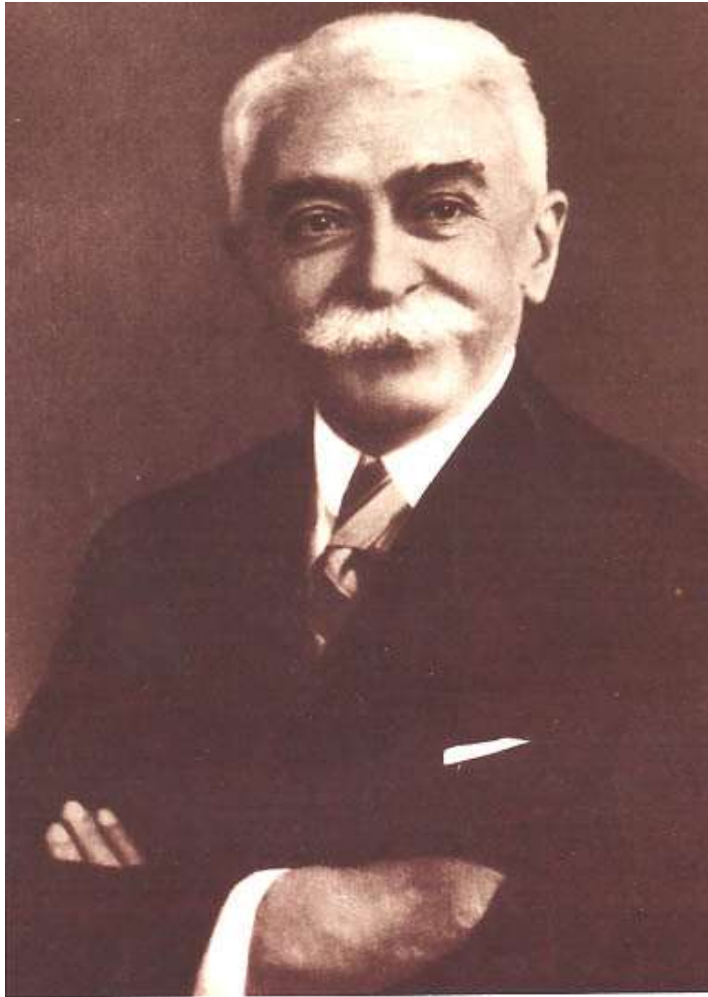
П'єр де Кубертен